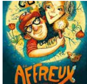
Spectacle pour les maternelles en collaboration avec la MCFA