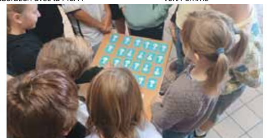
Animation par Child Focus pour les 5ème et 6ème primaires sur l'utilisation d'internet en toute sécurité et sur le (cyber)harcèlement.