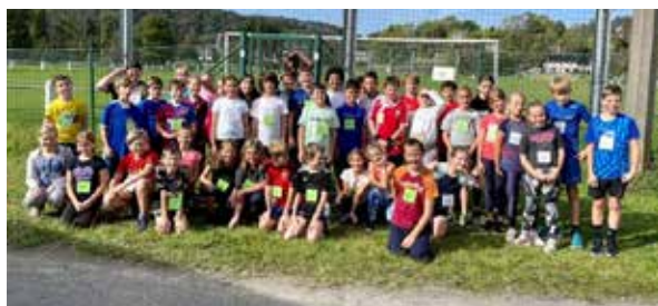
Cross de l'Adeps, onze de nos élèves sont sélectionnés pour les 1/2 finales et 3 ont décroché une médaille !