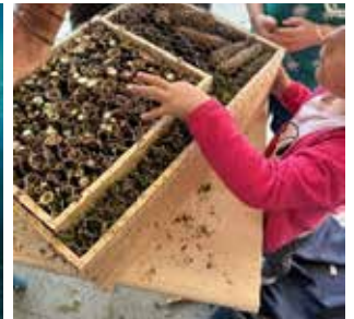
Réalisation d'hôtels à insectes avec l'Asbl Vert Pomme